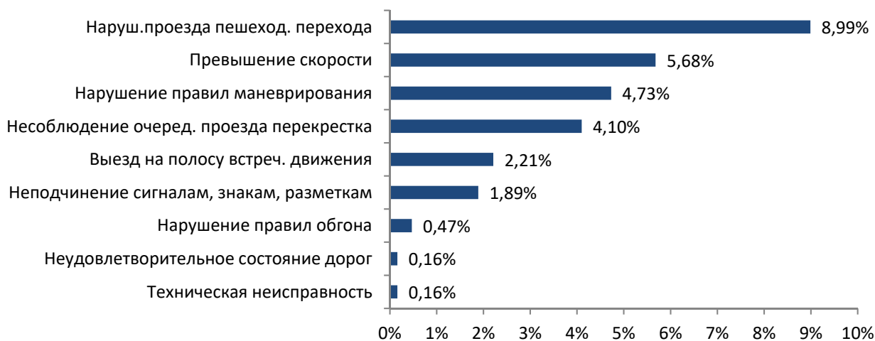
Рисунок 4 – Распределение ДТП по фактору организации движения

Большая часть аварий произошла на республиканских автомобильных дорогах, в областном центре и иных населенных пунктах.