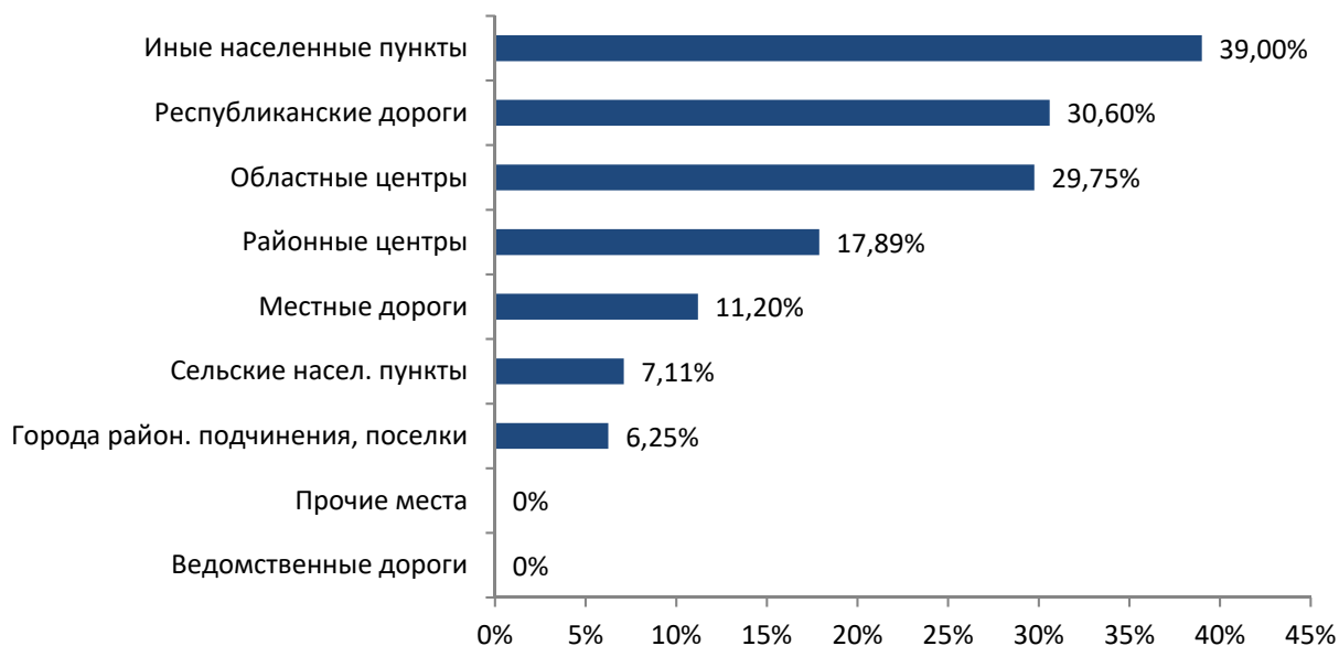
Рисунок 3 – Распределение ДТП по фактору места происшествия

нетрезвом состоянии, а 6% водителей скрылось с места ДТП. Высокой является и доля детского травматизма.