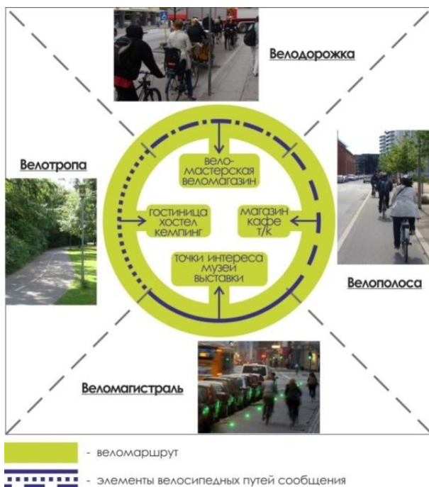
Рисунок 1 – Принцип формирования веломаршрутов

Веломаршрут состоит из разных участков велосипедных путей сообщения: велодорожки, велополосы, велотропы, веломагистралю и т.д. (таблица 1, рисунок 2).