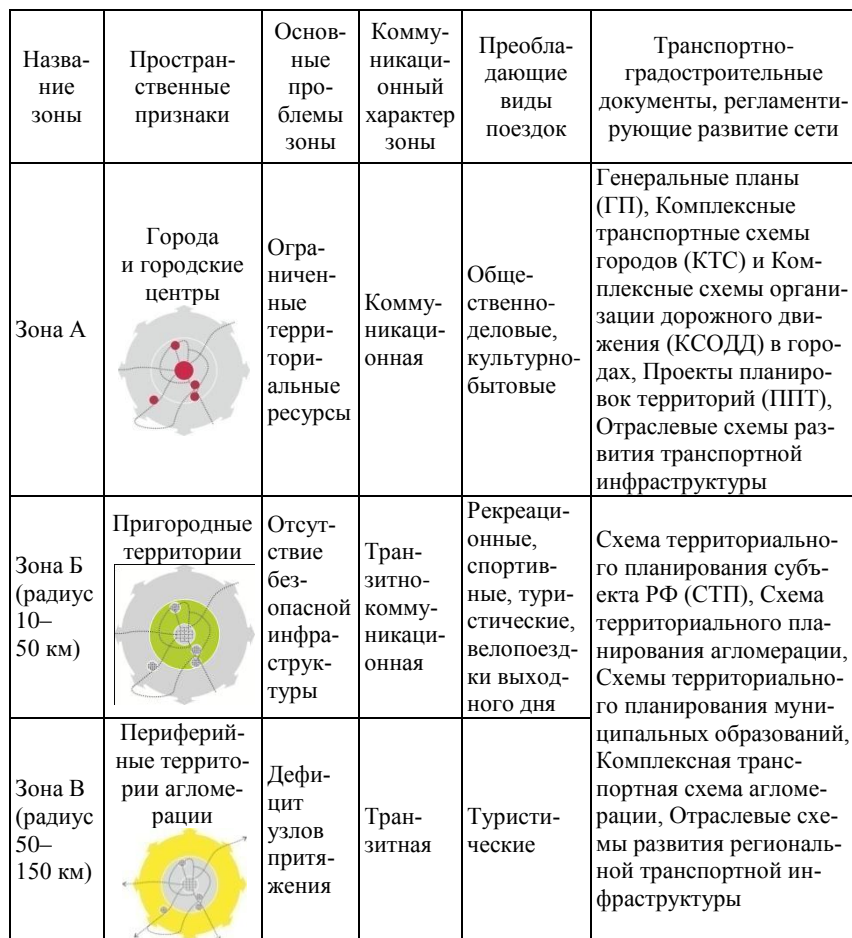
Таблица 2 – Пространственные, коммуникационные и функциональные характеристики зон агломерации (в целях развития сети веломаршрутов)

Для зоны В агломерации принципом развития становится обеспечение «вылетных» веломаршрутов, связывающих агломерацию с другими регионами Российской Федерации. Основная функциональная нагрузка велосипедной сети в этой зоне – поддержка тури-