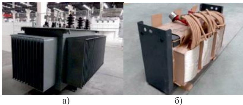
а – внешний вид; б – магнитопровод с катушками Рисунок 3. Трансформатор АТМГ ПГ «Трансформер»