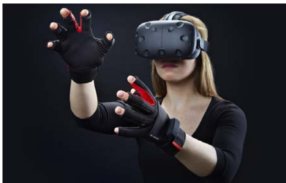
Рисунок 1 – Комплект оборудования для системы виртуальной реальности

программируемый вибрационный двигатель для тактильной обратной связи, а также SDK с открытым исходным кодом [2].