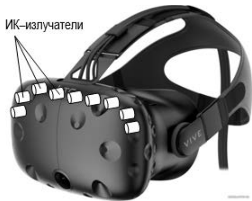
Рисунок 4 – Схема размещения ИК-излучателей на очках HTC Vive

Время переносимости тепловой радиации уменьшается с увеличением длины волны и её интенсивности. Таким образом, ИК-датчики целесообразно размещать внутри перчаток или внутри корпуса очков на лобной и височной части (рисунок 4).