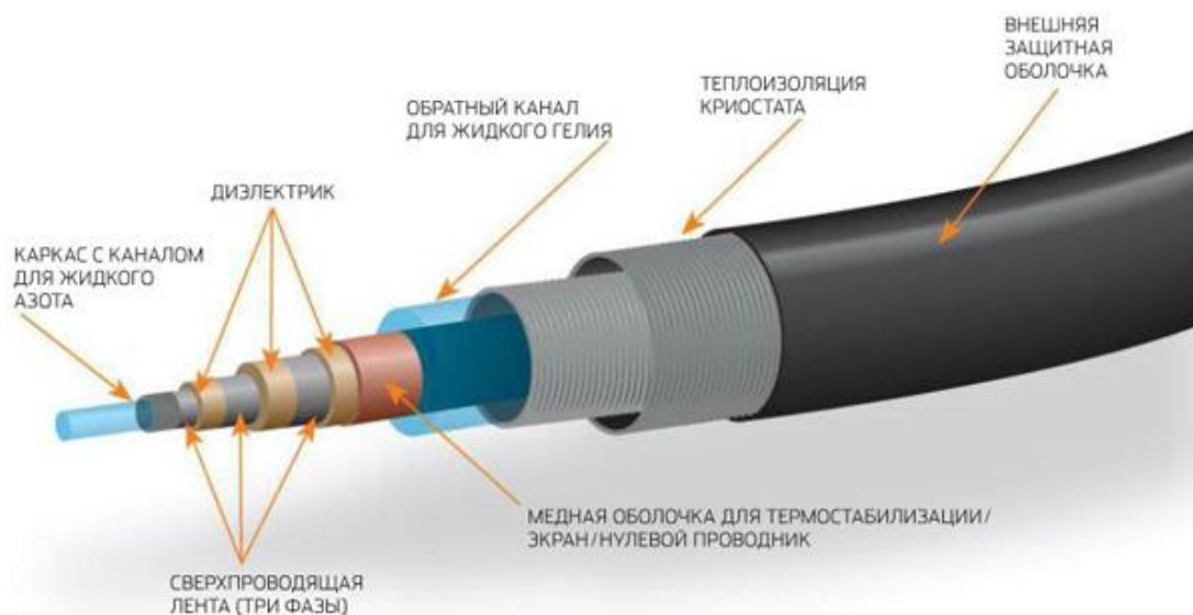
Рисунок 2 - Пример ВТСП проводника

ОБЩИЕСВЕДЕНИЯ О ВТСП КЛ. Упрощенно сверхпроводящий кабель устроен следующим образом (Рис 3.1). В центре обычно находится пучок медных проводов, диаметров около 20 мм, который является несущим элементом. На этот элемент по окружности укладываются ВТСП ламинированные латуной ленты 2-го поколения, то есть, проводников, где ВТСП-жила занимает лишь около 5% сечения (против 40% для ВТСП 1-го поколения) и представляет собой тонкое покрытие на поверхности подложки. Они укладываются спиралью, скручиваются под углом. 24 ленты – это первый слой (повив). Поверх этого слоя укладывается второй слой сверхпроводящих лент с противоположным направлением скрутки. Затем накладывается изоляция от 6 до 12 толщиной мм. Далее кладется еще примерно такое же количество сверхпроводящих лент – это так называемый сверхпроводящий экран. Поверх медный экранчик – это защита сверхпроводника. Этот кабель упаковывается в длинную гибкую трубу из гофрированной нержавейки. Причем труба эта двойная – внутренняя труба обмотана так называемой суперизоляцией, и между двумя трубами откачан воздух – это так называемая высоковакуумная термоизоляция. По внутренней трубе прокачивается жидкий азот. И таким образом сверхпроводящий кабель находится в криостате. Главная проблема – это надежная криогенная система, которая создает этот жидкий азот и качает его по длинному кабелю[3].