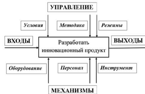
Рисунок 1 – Процесс разработки инновационного продукта в нотации IDEF0

или «чем меньше, тем лучше», или «чем больше, тем лучше».