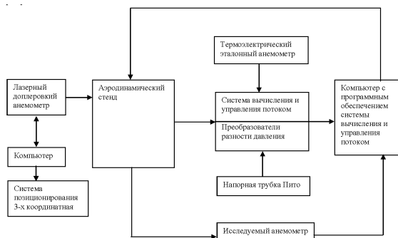
Рисунок 2 – Блок-схема комплекта аппаратуры для измерения скорости воздушного потока

Блок-схема комплекта аппаратуры для измерений скорости воздушного потока приведена на рисунке 2.