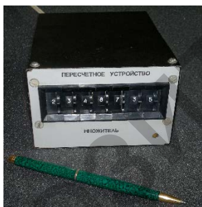
Рис. 3. Внешний вид приставки

Таким образом, возможна ручная установка (и визуальный контроль) произвольного коэффициента деления. Внешний вид приставки (пересчетного устройства) показан на Рис. 3.