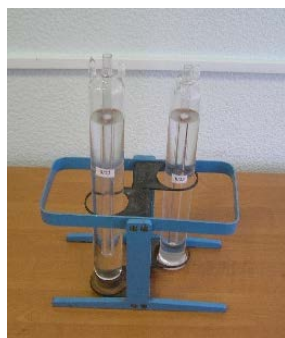
Рисунок 1 – Внешний вид ампулы тройной точки воды и вспомогательное оборудование