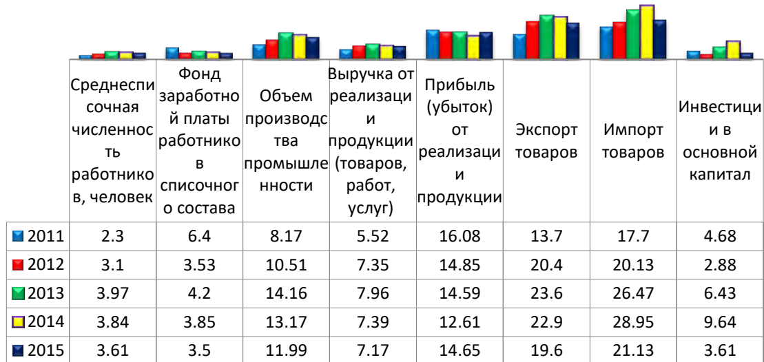
Рисунок 2 - Доля СЭЗ «Гродноинвест» в показателях экономического развития Гродненского региона Республики Беларусь в 2011-2015 гг., % [4]

на объем промышленного производства Гродненской области увеличилось с 8,17 % до 11,99%. Значительный рост вклада СЭЗ в областные показатели произошёл по показателям выручки от реализации продукции, который увеличился с 5,52 % до 7,17%; по экспорту – увеличился с 13,7 % до 19,6%; прибыль от реализации в данном периоде находится на уровне 14%; инвестиции в основной капитал в 2014 году достигнув высокого показателя в 9,7% в следующем году, вернулись к средним показателям за период; по фонду заработной платы работников списочного состава уменьшился с 6,4% до 3,5%; среднесписочной численности работников увеличилась с 2,3 до 3,6% (рисунок 2).