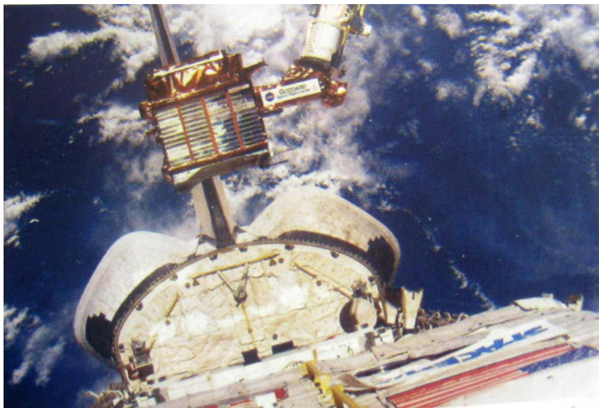
Рисунок 2. Управление бортовым манипулятором космического корабля «Шаттл» реализовано на основе QNX

Мировой опыт достаточно богат примерами построения решений на основе QNX, и среди них немало таких, которые связаны с ответственными или мобильными применениями, с системами двойного назначения, с использованием в условиях космоса, моря и т.д., то есть решений, которые можно рассматривать в качестве открытых аналогов многих военных применений.