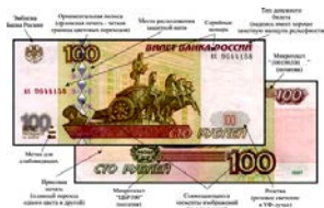
Рис. 1. Купюра 100 рублей образца 1997 г.

В ходе работы были исследованы денежные купюры номиналом 1000, 500 и 100 рублей ЦБР. При изготовлении современных российских банкнот используются защитные признаки, по которым определяется их подлинность.