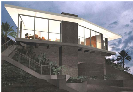
Рисунок 1 – Экодом в городе Манчестер в штате Нью Гэмпшира (США)

Развитие энергоэффективных построек восходит к исторической культуре северных народов. Примером техники повышения энергоэффективности дома является русская печь, отличающаяся толстыми стенками, хорошо сохраняющими тепло, и оснащенная дымоходом со сложной конструкцией лабиринтов. К современным экспериментам повышения энергоэффективности зданий можно отнести сооружение, построенное в 1972 году в городе Манчестер в штате Нью Гэмпшир (США) (рисунок 1). В 1973–1979 годах был построен комплекс «Econo-House» в городе Отаниеми, Финляндия.