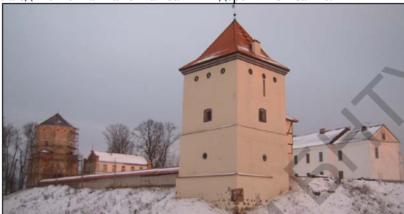
Рисунок 1 – Общий вид замка

возведена в конце XVI в. Фундамент ее из больших валунов уходит в землю почти на 4 м. Внутри здания находилась тюрьма. Вначале это была единственная каменная башня в деревянном замке.