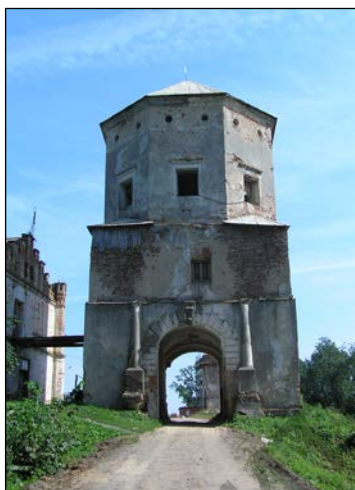
Рисунок 2 – Общий вид надвратной башни

В 1640 году новым хозяином Любчи стал виленский воевода и великий гетман литовский Януш Радзивилл, сын Крыштофа. В 1655 году многочисленный казачий отряд И.Золоторенки захватил местечко и приступом взял замок. Большая часть жителей Любчи была убита или уведена на поселение в Россию, храмы и типография разграблены, а замок частично взорван. А сам Ян Радзивилл был отравлен наемными убийцами.