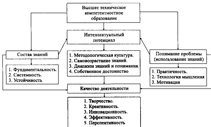
Рисунок 3 – Содержательная структура высшего образования инженера-менеджера

имитационное моделирование и ситуационный анализ на основе военных игр и компьютерных информационно-интеллектуальных систем обучения (кейсы); соответствующая учебная и войсковая практика; педагогический мониторинг на основе оценочно стимулирующей деятельности как курсантов, так и преподавателей.