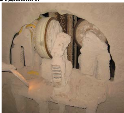
Рис. 1. Роликовые направляющие с пружинным амортизатором с резиновой ограничительной вставкой

Исследования показали, что роликовые направляющие, применяемые в настоящее время на большегрузных скипах, работают не эффективно, они не обеспечивают безударного движения скипа по направляющим проводникам.