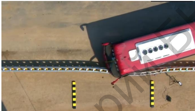
Рисунок 3 – Краш-тест барьерного ограждения Road Roller System (вид сверху)

Малайзия стала первой страной, в которой прямо сейчас опытным путем исследуют данную роликовую дорожную систему на самых опасных участках дорог.