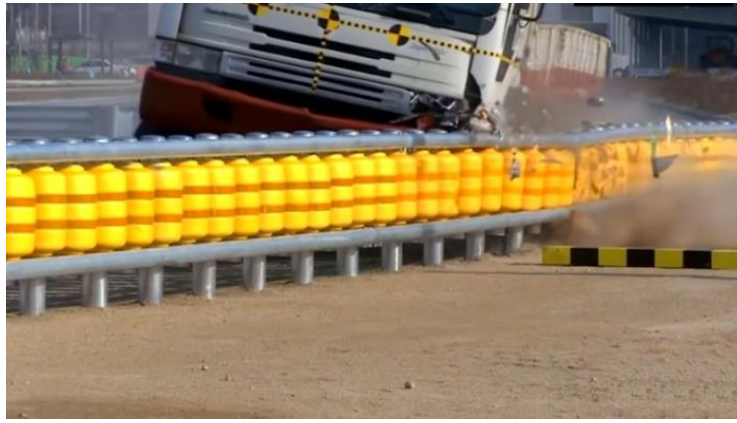
Рисунок 2 – Краш-тест барьерного ограждения Road Roller System (вид сбоку)