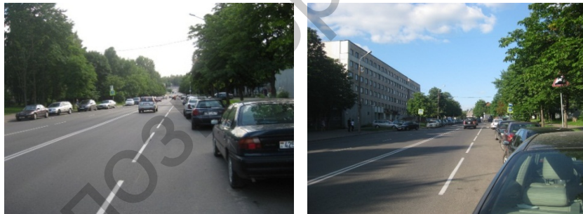
Рисунок 1 – Исследуемый нерегулируемый пешеходный переход (вид со входов)

В научно-исследовательском центре дорожного движения филиала БНТУ «Научно-исследовательская часть» проводятся работы по повышению качества дорожного движения как на отдельных транспортных объектах, так и на участках дорожной сети городов. Мероприятия позволяют снизить аварийные, экономические и экологические потери. Как правило, заказчиком проведения данных работ является Управление ГАИ ГУВД Мингорисполкома, совместно с которым производится мониторинг аварийно-опасных участков. Так, для исследований выбран нерегулируемый пешеходный переход через ул. Варвашени возле д.11, который расположен в Заводском районе г. Минска. Улица Варвашени является магистральной улицей районного значения (категория Б4 по ТКП 45-3.03-227-2010) (рисунок 1). По улице Варвашени вдоль всей проезжей части крайние правые полосы используются для стоянки транспортных средств. Поэтому движение осуществляется только по вторым полосам.