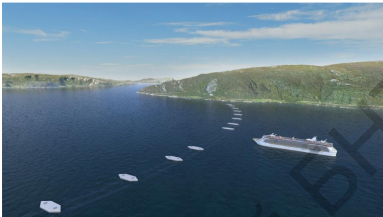
Рисунок 3 – Подводный мост

водой (Рис. 3), однако эти конструкции имеют и недостаток - они подвержены повреждениям из-за неоднозначности погоды. Конструкции также имеют риск столкновения с кораблями ВМС, которые иногда используют воду для обучения.