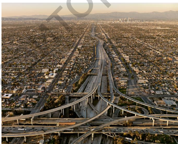
Малюнак 1 – Развязка імя суддзі Гары Преджерсона

Яе адкрылі ў 1993 годзе. Развязка была названая ў гонар суддзі Гары Преджерсона. Ён доўга займаў пасаду федэральнага суддзі і старшыняваў у судовым працэсе па справе будаўніцтва аўтамагістралі I-105. Гэтая развязка лічыцца адной з самых складаных у свеце (Мал. 1)