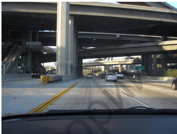
Малюнак 2 – Транспарт, які заязджае на развязку

могуць трапіць на магістралі для пасажырскага транспарту I-110. Аўтамабілісты, якія ўязджаюць з паўднёвага боку на магістралі для пасажырскага транспарту I-110, не маюць прамога доступу на магістралі I-105, і могуць проста рухацца далей у паўночным кірунку. Вадзіцелі пасажырскага транспарту, якія хочуць трапіць на пэўны шашы, да якога не прадугледжана прамая злучальная магістраль, павінны выехаць з паласы руху для пасажырскага транспарту ў пэўным месцы ўезду/выезду перад развязкай і перамясціцца на галоўную злучальную магістраль, як звычайна робяць на ўсіх пасажырскіх палосах руху ў паўднёвай Каліфорніі. (Мал. 2)