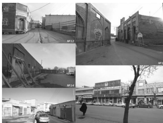
Рис.1. Застройка исторического района города Ардебиль

ских комплексов в составе культурно-туристической зоны. Район ограничен 3-я магистралями: «Шейх Сафи Ад Дин», «Алатолла Талегани», «Имам Хомейни», в пределах района расположены памятники историко-культурного наследия: Хамам, комплекс мавзолея шейха Сефи ад-Дина, входящий в 10-ку самых красивых мест Ирана, по мнению ЮНЕСКО, и другие (рис. 2).