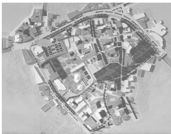
Рис. 5. План озеленения исторического района

Необходимо уменьшить процент жилой застройки в историческом районе города Ардебиль, за счет этого увеличить процент озеленения общего пользования и общественных объектов. С целью улучшить экологическую ситуацию в планировочном ядре города разработано предложение по озеленению, элементам благоустройства и МАФ. Увеличено озеленение улиц с регулярными посадками деревьев, в центре района организован парк на месте стихийно-организованной автостоянки, который взаимосвязан с существующим сквером и другими проектируемыми озелененными бульварами, формируя тем самым зеленую сеть реконструируемого района (рис. 5).