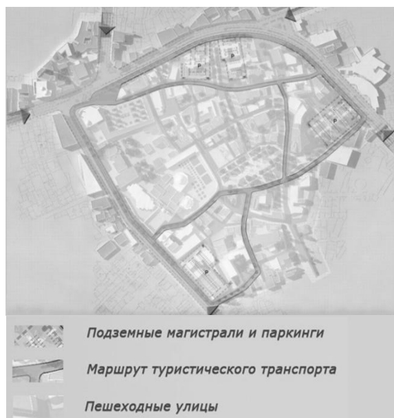
Рис. 4. Схема транспортного и пешеходного движения

Сетка улиц реконструирована, существующий массив застройки разделен на более мелкие ячейки для комфорта и удобства пешеходов. В узловых точках полученной пешеходной сети размещаются также объекты общественного назначения. Общественные и административные здания формируются в комплексы и организуют узлы общественного назначения – точки притяжения потоков людей. Они располагаются в зоне доступности общественного транспорта, а также в пешеходной доступности от кварталов жилой застройки.