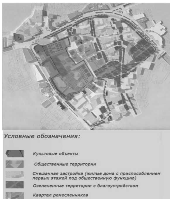
Рис. 3. Перспективная схема функционального зонирования исторического района

В рамках концепции центральный район сделан полностью пешеходным и связан пешеходными связями с другими значимыми объектами исторического центра города Ардебиль, транспортные магистрали перенесены под землю. Это решение значительно снизит шумовое загрязнение, но вызовет вибрации от подземных магистралей. Соответственно для объектов, оказавшихся в зоне дискомфорта, предусмотрены мероприятия по защите от вибрации. Наземные автостоянки заменены подземными паркингами с лифтами и лестницами.