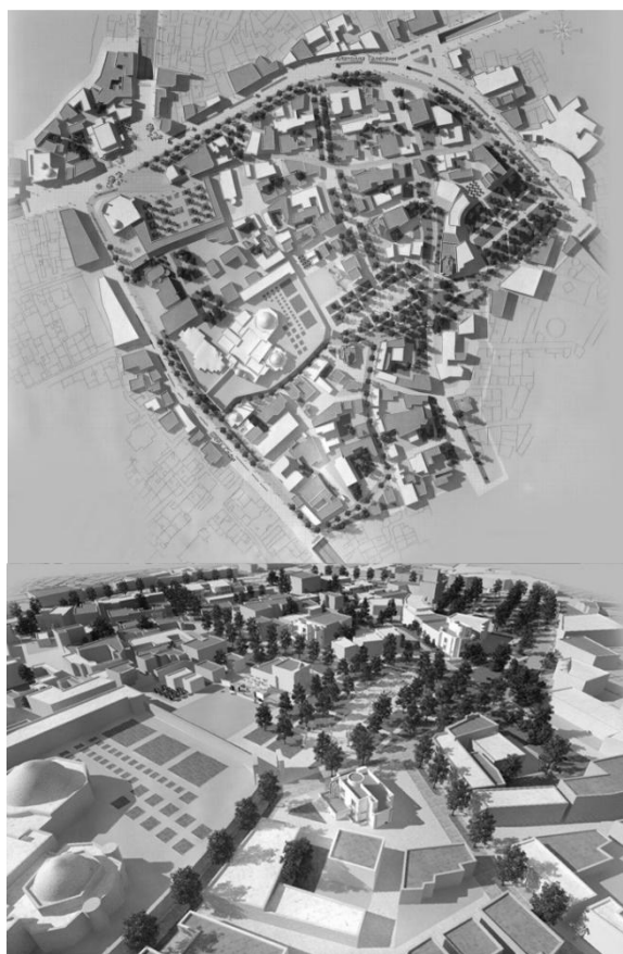
Рис. 7. Проектное предложение реконструкции и благоустройства исторического района