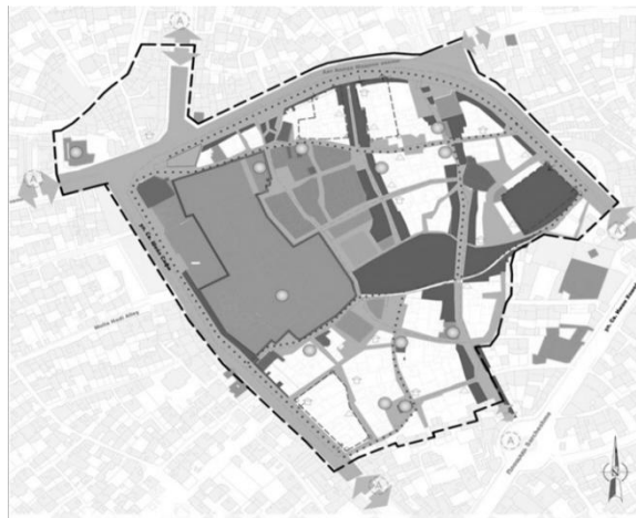
Рис. 6. Концепция реновации исторического района

стройки: жилыми домами, гостиницами различных категорий, торговыми центрами, ресторанами, не превышающими ограничения по максимальной высоте зданий для данного исторического района (рис. 6, 7).