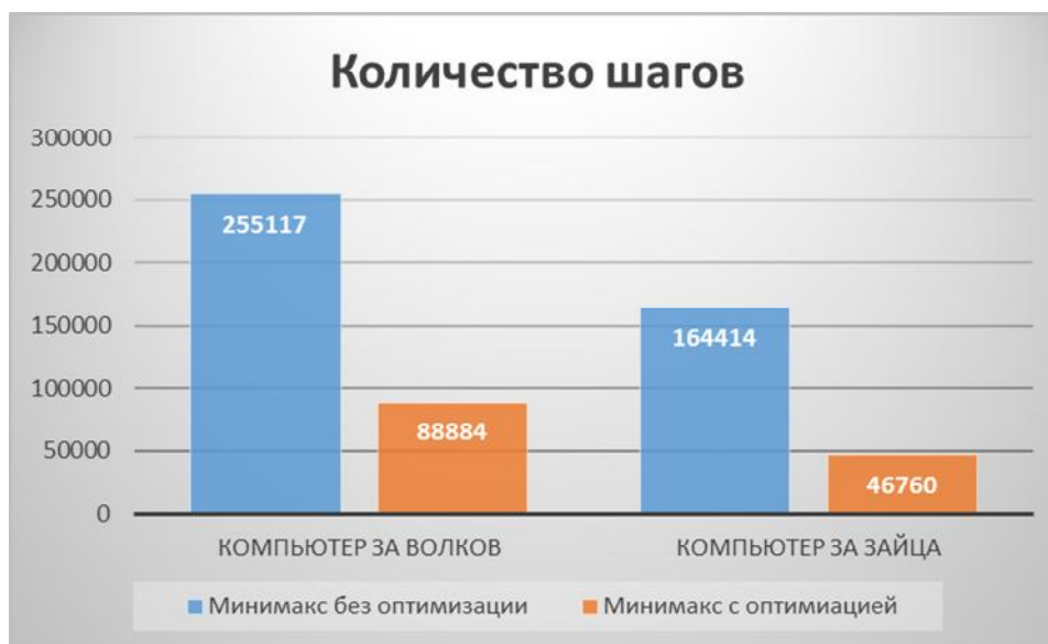
Рисунок 1 – Сравнение объема перебора алгоритма с оптимизацией и без нее

Эффективность работы выше описанного метода была проверена на практике и получены результаты представленные на рисунках 1 и 2.