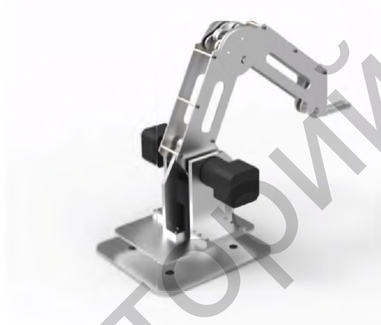
Рисунок 1 – Внешний вид многофункционального манипулятора

Система управления (СУ) разрабатывается для многофункционального манипулятора, показанного на рисунке 1. Он имеет три степени подвижности. Его звенья перемещаются с помощью шаговых приводов(ШД).