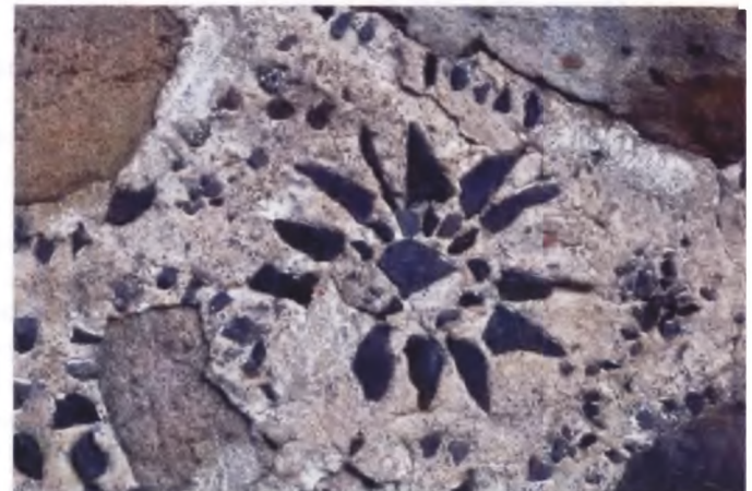
Рисунки 14–19. Амбар в Погоще Браславского района (1820-е). Фрагменты декорации стен