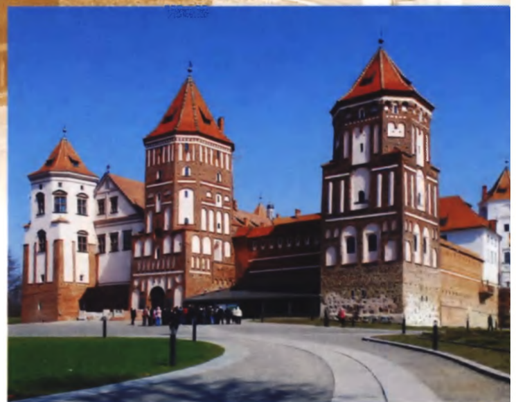
Рисунок 1. Замок в Мире, XVI век

Широко применяли камень в оборонительных сооружениях XIV–XVI веков (Кревский, Лидский, Мирский замки) — фундаменты и нижние ярусы стен и башен, что придавало сооружениям прочность