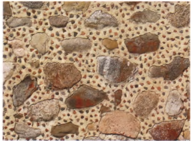
Рисунок 21. Хозяйственная постройка в Клешино Вилейского района, конец XIX века

Здания с подобным декором, но относящиеся к более позднему времени — к середине и второй половине XIX века, в Беларуси также встречаются довольно часто, хотя в большинстве использовалось равномерное распределение мелких камешков россыпью между валунами (церковь в Ласице Поставского района, костел в Бенице Молодечненского района, ограда костела в Мамаяя Глубокского района, хозяйственные постройки в Арпе и Клешино Вилейского района и др. (рисунок 21). Хотя порой встречаются примеры, родственные более ранним браславским мозаикам, — «елочка» и «солнышко» в ограде костела в Мосаре Глубокского района. А в известь между камнями ограды костела в Поро-