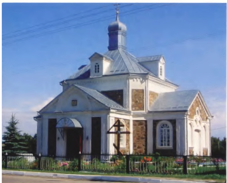
Рисунок 4. Спасо-Вознесенская церковь в Копыле, вторая половина XIX века

и основательность (рисунок 1). Впоследствии расширяется строительство исключительно из кирпича. Наиболее известные сооружения XVI века, являющиеся самыми характерными представителями древнего белорусского зодчества, — церкви оборонного типа в Мурованке Щучинского и Сынковичах Зельвенского районов, костел в Гнезно Волковысского района, возведены из кирпича, причем строители показали умение решать не только технические проблемы.