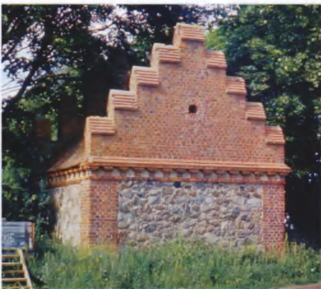
Рисунок 6. Каплица в Репле Волковысского района, начало XX века

Особенность старых стен этого сооружения в том, что внешняя поверхность стен формировалась камнями, уложенными на известку, в которую между камнями втоплены небольшие камешки — колотые кусочки магматических пород, обычно темного цвета (рисунки 7–9). Эти кусочки щебня размером в 1–3 см размещены, на первый взгляд, хаотично. Но при внимательном рассмотрении выявляются определенные закономерности, указывающие, что это не просто технический прием, направленный на укрепление кладки, а декоративное убранство здания. Наиболее распространенный прием декора — размещение мелких камешков на стене россыпью, которая более или менее равномерно заполняет