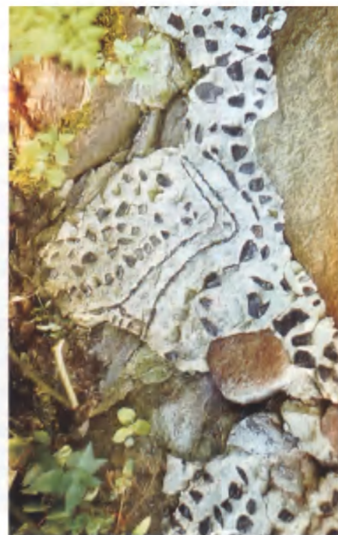
Рисунки 10–13. Водяная мельница в Зарачье Браславского района (1820-е). Фрагменты декорации стен