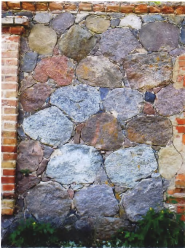
Рисунок 20. Кузница в Шеметово Мядельского района, конец XIX века

го века, в которых добывали кремний 5 тысяч лет назад). Существовавшие в 1970-х годах остатки хозяйственных строений на месте бывшей деревни Гвоздово в Мядельском районе (первая половина XIX века) декорированы сюжетами /2, с. 45/, восходящими к соляным или охранным знакам языческих времен (круги, разделенные на четыре сегмента, крупное ветвистое дерево и др.).