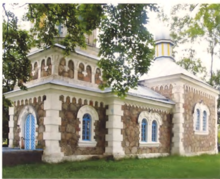
Рисунок 5. Церковь Рождества Пресвятой Богородицы в Докудово Лидского района, 1865–67 годы

В конце XIX — начале XX веков появление рестороспективных стилей (неороманский и неорусский стили, неоготика, и др.) и модерна содействовало возобновлению строительства зданий с неоштукатуренными стенами из кирпича — церковь в Лунинце, усадебный дом в Россонах, костелы в Видзах и Опсе Браславского района, Ракове Воложинского района и др.), и камня — костелы в Липнишках Ивьевского района, в Лунно Мостовского района, хозяйственные и производственные постройки во многих усадьбах, ограды культовых и усадебных комплексов, например, в Шиманелях Сморгонского района (рисунок 3). Широко использовались также сочетания этих материалов — церкви в Копыле (рисунок 4), в Докудово Лидского района (рисунок 5), костел в Иказни Браславского района, церковь в Турце Кореличского района, часовня в Репле Волковысского района и др. (рисунок 6). Выразительность архитектуры этих зданий во многом определялась умелым использованием красоты фактуры материала и изобретательностью местных мастеров. В определенной мере эти сооружения позволяют отметить, что художественные традиции местных архитектурных школ не были утеряны