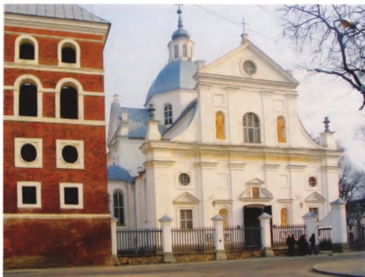
Рисунок 2. Костел в Несвиже, XVI век