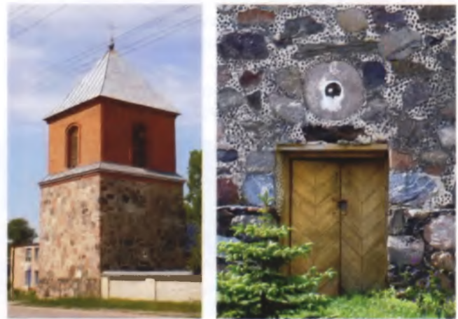
Рисунки 22–23. Колокольня в Волколатах Докшицкого района, конец XIX века

зово Свислочского района (XIX век) густо вставлены черепки керамики, причем именно чернолощеной, изготавливаемой только в этом регионе Беларуси и являющейся несомненной особенностью местной культуры. А стены колокольни в Больших Жуховичах Кореличского района декорированы кусочками своей, местной коричневой керамики. В стену часто вставляли обломки мельничных жерновов, а то и целый, но уже пришедший в негодность жернов — колокольня в Волколатах Докшицкого района, конец XIX века (рисунки 22–23).