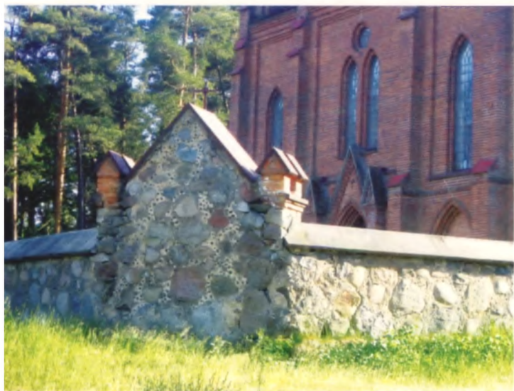
Рисунок 3. Ограда костела в Шиманелях Сморгонского района, начало XX века