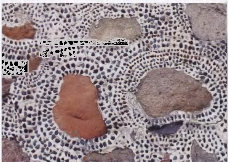
Рисунки 7–9. Костел Божьего Тела в Браславе (1824). Фрагменты декорации стен