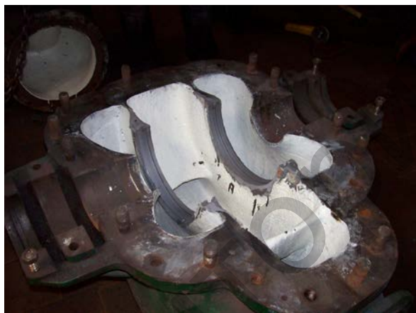
Рис. 1. Корпус насоса Д1250 с восстановленными мультиметаллом посадочными поверхностями под диффузорные кольца и защитным химически стойким композитным покрытием

пы восстановления гнезд подшипников качения, например насоса Д2000, заключались в следующем. Вначале поверхность гнезда подготавливали к нанесению материала, на что требовалось от 1 до 2 ч. Затем двухкомпонентный материал мультиметалл смешивали и наносили на поверхность гнезда с помощью шпателя. В это время подшипник, формирующий свое гнездо, обрабатывали разделительным составом, который не позволял мультиметаллу прилипнуть к наружной поверхности кольца подшипника. Данные операции занимали 0,5 ч. Затем вал вместе с подшипниками опускали в гнездо на заранее выставленные или наплавленные маячки и подшипник затягивали крышкой, излишки материала выдавливались из гнезда. После затвердевания материала (5–6 ч) вал демонтировали, очищали гнездо подшипника от выдавленных излишков мультиметалла и вновь собирали узел. Аналогичным образом восстанавливали в корпусах насосов Д1250 посадочные поверхности под диффузорными кольцами (рис. 1).