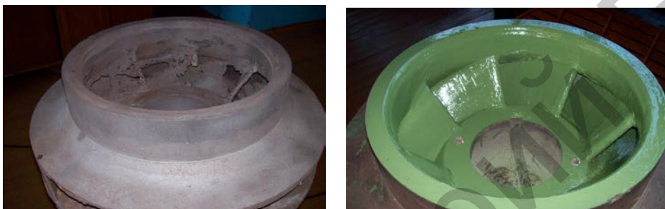
Рис. 3. Восстановление лопаток перекачивающего насоса Fig. 3. Recovery of the vanes of the transfer pump

Отечественный материал ДК2, который имеет полиуретановую основу и невысокую стоимость, позволяет выполнять защитные покрытия оборудования, применяемого прежде всего в энергетике, например корпуса насосов, поверхности лопаток колес, поверхности задвижек и т. п. Пример восстановления и защиты лопаток насоса от износа приведен на рис. 3.