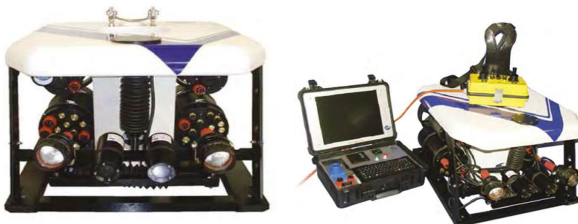
Рисунок 1 – Прибор для подводного обследования «Сабфайтер 3000» компании ОАО «Тетис-ПРО»