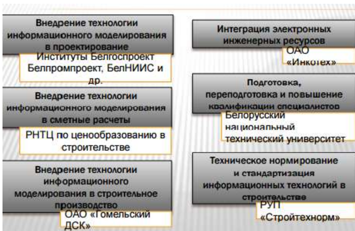
Рисунок 3 – Основные задачи и исполнители отраслевой программы.

Результат на первоначальной ступени, чаще всего, неприемлем и это тянет за собой трудовые и финансовые затраты. Но спрос по сравнению с классической технологией строительства возрастает и это дает возможность развиваться дальше.