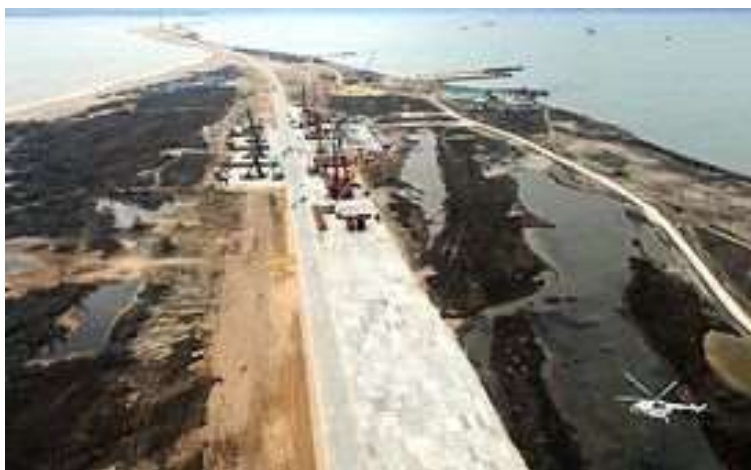
Рисунок 3 - Начало строительства на полуострове Тулуза

Тип конструкция моста - Ферменный с аркой, общей длиной 227м. Основной пролет 227м. Общая длина составляет 19 км. Высота конструкции 35 м, высота свода над водой 35 м, полос движения 6 (4 для авто и 2 ж/д). Стоимость проекта составляет 227.92 млрд рублей.