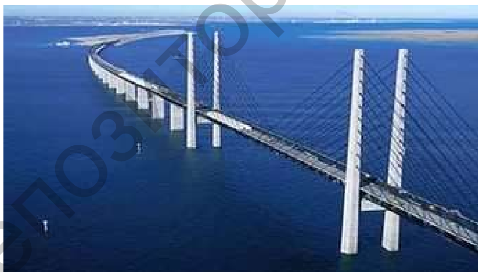
Рисунок 1 - Керченский мост (проект)

В январе 2015 года был подписан многомиллиардный контракт для строительства моста. В мае 2015 года, строительство моста началось; она, по прогнозам, будет открыт 18 декабря 2018 года.