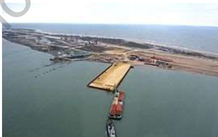
Рисунок 2 - Баржа доставляет компоненты моста

Летом 2015 года в Таманском сельском округе и в Керчи возводятся вахтовые города для будущих строителей моста через Керченский пролив. Комплексы общей вместимостью до 6 тысяч человек включают общежития, офисные здания, дома строителей, столовые, банно-прачечные комплексы, медпункты.