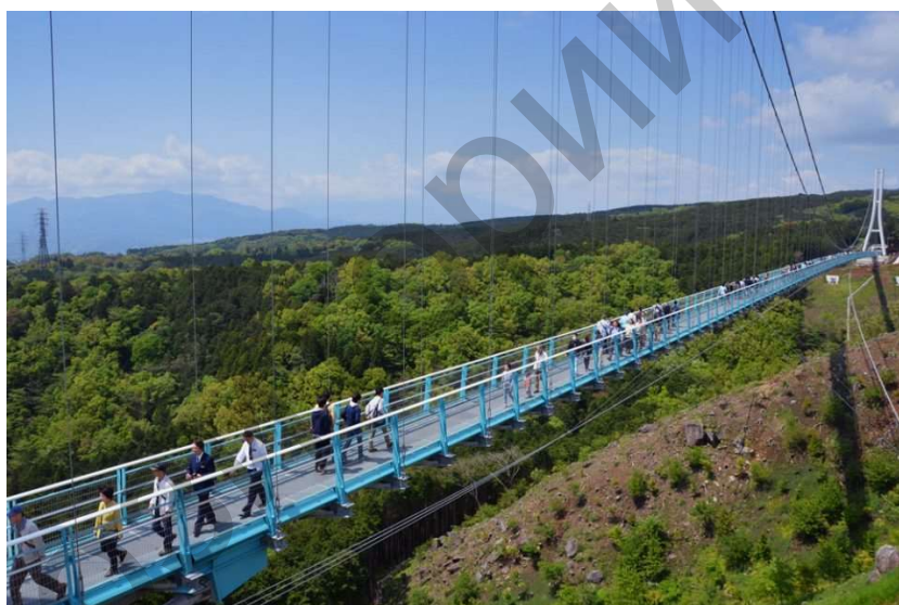
Рисунок 3 – вместимость

Сама конструкция рассчитана не только на обычных пешеходов, но и на людей с ограниченными возможностями перемещения: ширина пешеходной части позволяет легко проезжать двум инвалидным креслам. Власти префектуры Сидзуока рассчитывают, что данное романтическое сооружение, имеющее в своём составе небольшой торговый центр и ресторан, будет пользоваться большой популярностью и ежегодно привлекать около 1,8 миллиона туристов, в том числе зарубежных. Цифра не является конечной, поскольку примерно в 20 километрах от моста расположен не менее популярный горный курорт Хаконэ, знаменитый своими горячими источниками, многочисленными музеями и горным озером Асиноко, с которого открывается прекрасный вид горы Фудзи.