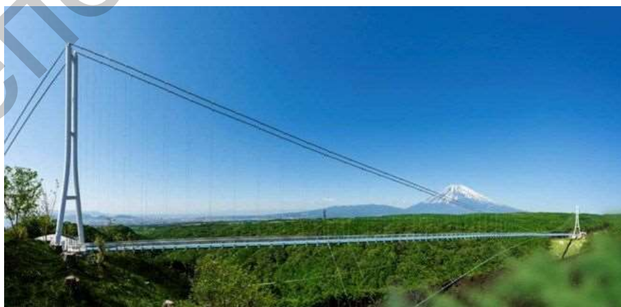
Рисунок 2 – профиль моста