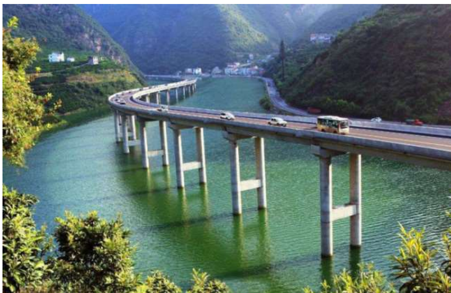
Рисунок 1 – Новое шоссе в Китае

Эта дорога позволяет сократить часовую поездку всего до 20 минут и открывает весь пейзаж этого маршрута. Раньше водителям приходилось более часа добираться по извилистой дороге, а теперь появилась возможность сократить маршрут.