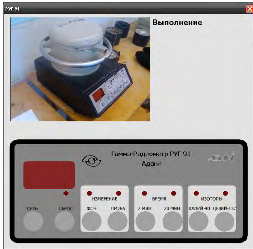
Рисунок 1 – Внешний вид радиометра РУГ 91 «АДАНИ» в эмуляторе

В качестве языка программирования, для разработки эмулятора, был выбран С#. В среде разработки спроектированы рабочие элементы прибора: корпус прибора МЭС-200А (рисунок 2) и щуп измерительный (рисунок 3).