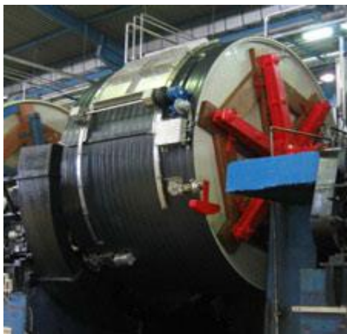
Рис. 2 – Подвесной зольный барабан

Отмок и озоление кож, как и все жидкостные процессы, осуществляются в зольных барабанах (рис. 2). Продолжительность процесса составляет 48 часов. Механическое воздействие барабана на сырьё и полуфабрикат во время обработки достигается вращением подвесных, рамных барабанов, реверсированием (вращение поочерёдно то в одном, то в другом направлении) или покачиванием шнековых барабанов, перемешиванием шкур и жидкостей с помощью мешалок в баркасах.