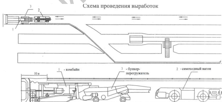
Рис. 1 – Размещение и движение самоходного вагона в шахте

На калийных рудниках для доставки отбитой проходческим комбайном горной массы к конвейерам на расстояния до 200 метров используют колесные самоходные шахтные вагоны (ШВС) (рис. 1). Привод колес вагона осуществляется от электродвигателей по бортам, их свойства обуславливают большую динамичность трогания с места и остановки ШВС, а значит и высокую нагруженность приводов колес, дергания вагона на этих режимах движения. Такая особенность характерна также и для новых зарубежных и отечественных моделей самоходных вагонов. Использование частотного регулирования тяговых электродвигателей не устраняет отмеченной динамики.