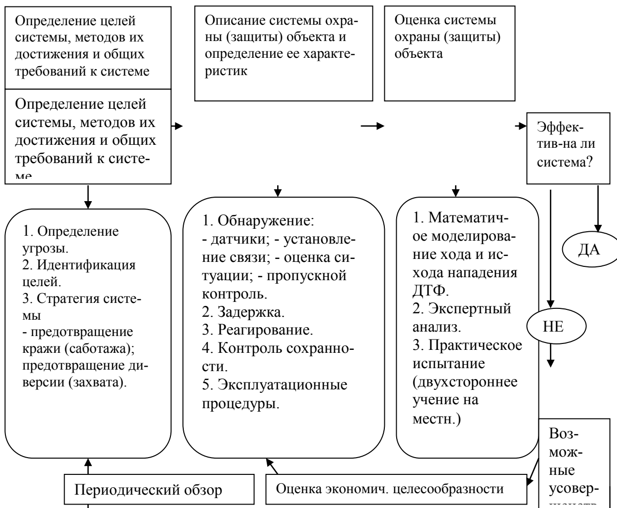
Рисунок 2 – Структурно-логическая схема содержания и последовательности процесса «анализа эффективности системы охраны объекта»

1. В результате ранее проведенного исследования решена проблемная задача, заключающаяся в разрешении противоречий между практикой, остро нуждающейся в научных рекомендациях по обеспечению безопасности объектов в условиях угрозы диверсионно-террористического воздействия противника и теорией, не имеющей достаточной научной базы для такого обеспечения.