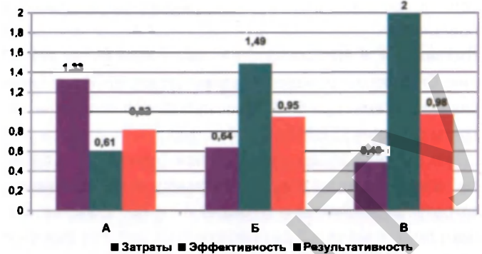
Рисунок 4 – Интегральные показатели качества процесса поверки СИ: А. – в вагоне-лаборатории; Б. – в стационарной лаборатории; В. – в лаборатории метрологии, организованной на дистанции

Расчетная стоимость проведения поверки одного СИ [стоимость функции А0 модели поверки СИ (рисунок 2)]