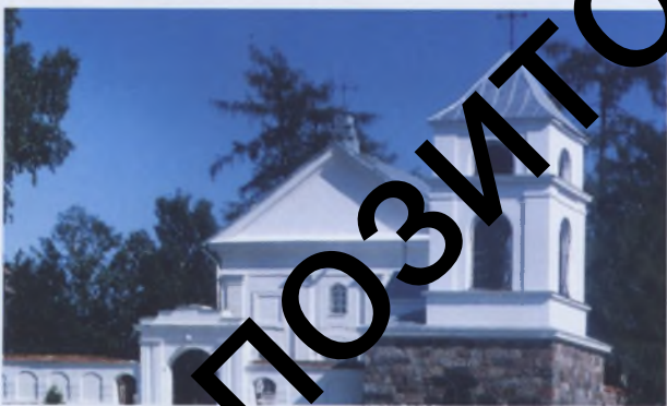
Рис. 23. Колокольня в Мосаре Глубокского р-на. XIX век