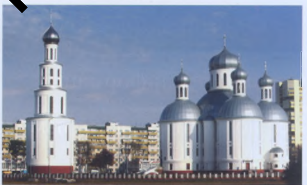
Рис. 25. Колокольня Свято-Воскресенского собора в Бресте. Начало XIX века