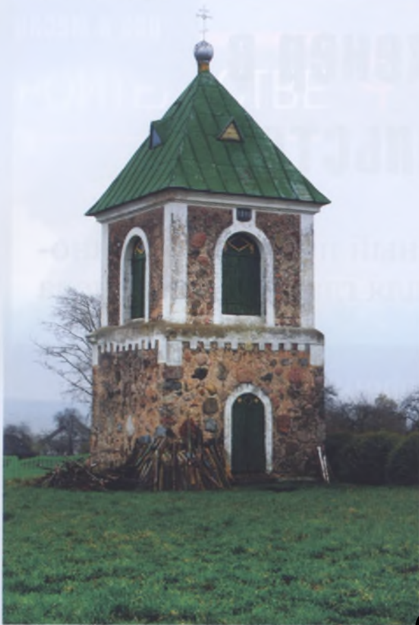
Рис. 22. Колокольня в Больших Жуховичах Кореличского р-на. 1891 год