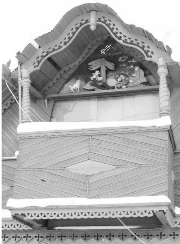
Рис. 6. Элементы декора балкона жилого дома по ул. Бородина в г. Могилеве

Таким образом, исходя из уровня мастерства в области обработки древесины и выбранной тематики художественного оформления, можно судить не только о профессиональной принадлежности хозяина жилища, но и о его увлечениях.