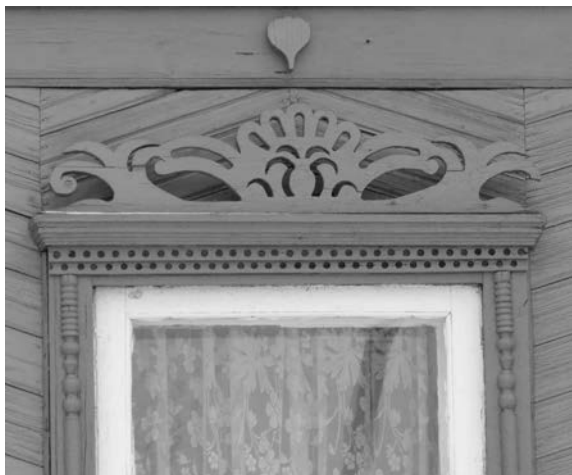
Рис. 3. Варианты декора оконных проемов

Отдельные элементы фасада помимо эстетических функций выполняют и чисто эксплуатационно-технические задачи. Так элемент обрамления окна с ярко выраженным козырьком в верхней части (рис. 4) обеспечивает дополнительную конструктивную защиту от атмосферной влаги и снега отдельных частей оконной рамы, что позволяет не только продлить срок эксплуатации конструкции самого окна, но и обеспечить уменьшение звукового воздействия от попадания на стекло атмосферных осадков.