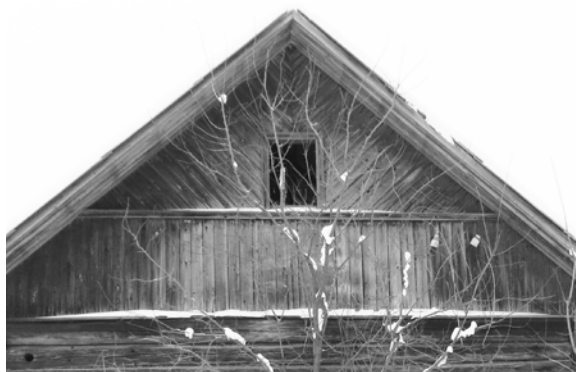
Рис. 1. Пример обшивки досками фронтона двускатной крыши

имели паза и шипа, щели прикрывались накладываемой сверху такой же доской или узкими рейками.