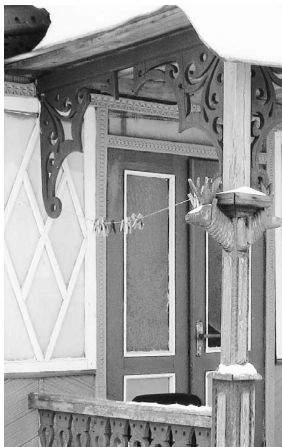
Рис. 5. Элементы входной группы жилого дома по ул. Бородина в г. Могилеве

Индивидуальное архитектурно-художественное решение данного объекта обеспечено за счет использования резьбы по различным деревянным элементам фасада. Так на стволе колонн, поддерживающих козырек над главным входом в дом, расположены украшения в виде оленьих голов, вырезанных из дерева, а по сторонам от капителей этих же колонн декоративная резьба несет в себе уже растительные мотивы (рис. 5).