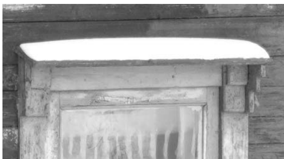
Рис. 4. Конструкция декоративного козырька над оконным проемом

Отдельные элементы фасада помимо эстетических функций выполняют и чисто эксплуатационно-технические задачи. Так элемент обрамления окна с ярко выраженным козырьком в верхней части (рис. 4) обеспечивает дополнительную конструктивную защиту от атмосферной влаги и снега отдельных частей оконной рамы, что позволяет не только продлить срок эксплуатации конструкции самого окна, но и обеспечить уменьшение звукового воздействия от попадания на стекло атмосферных осадков.