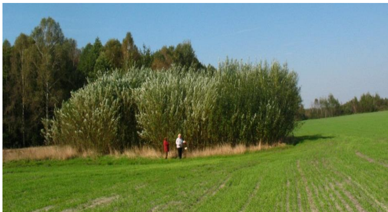
Рис. 2 - Плантация быстрорастущей ивы третьего года выращивания на деградированных торфяных почвах.

Среди нескольких десятков загрязнителей водных ресурсов в аграрных ландшафтах можно выделить азот и фосфор, так как попадание этих элементов в водные объекты провоцирует процессы эвтрофикации последних. Практический опыт и результаты научных исследований свидетельствуют, что главной причиной эвтрофикации является избыточное поступление в водоемы фосфора, и значительно реже – азота, основным источником которых является сельскохозяйственная деятельность. Наиболее серьезное воздействие связано с внесением минеральных удобрений, что подтверждается многолетними статистическими данными.