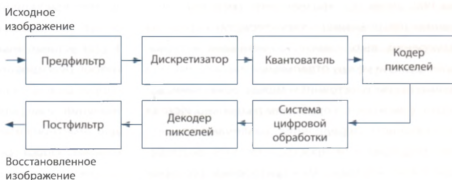
Рисунок 5 – Этапы цифровой обработки изображений

При этом перед цифровой обработкой изображения осуществляется его предфильтрация, затем следуют дискретизация, квантование, кодирование, декодирование и постфильтрация пикселей. Поскольку все эти операции предполагают потери информации, а следовательно, влияют на результирующую разрешающую способность цифрового изображения, интерес представляют соответствующие термины и их определения. При восстановлении изображения после декодирования пикселей производится постфильтрация [26]. Если даже B(x, y) изменяется во времени, предполагается, что объем информации