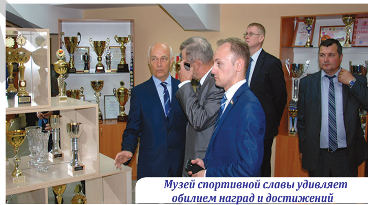
Музей спортивной славы удивляет обилием наград и достижений