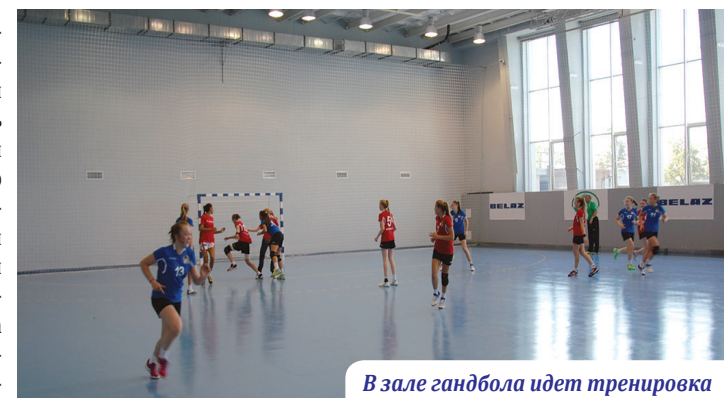
В зале гандбола идет тренировка