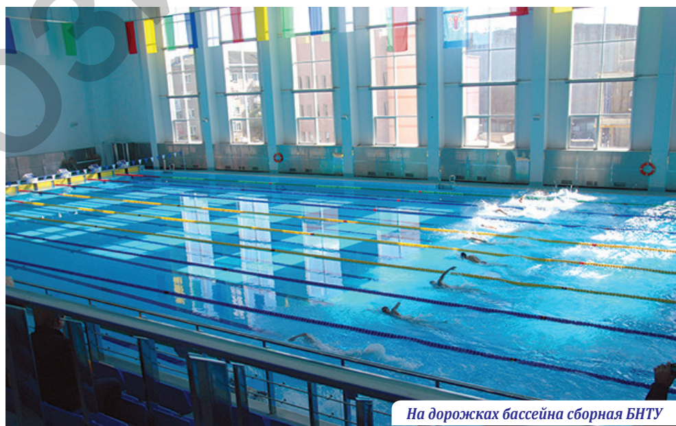
На дорожках бассейна сборная БНТУ