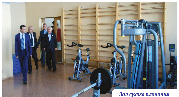
Зал сухого плавания

располагает современной спортивной базой, сегодня это 18 спортивных залов, стадион, лыжная база, спортивные площадки, бассейн. Ежегодно в университете проводится спартакиада среди сборных команд факультетов по 20 видам спорта, регулярно проходят Дни здоровья и соревнования среди студентов, прожи-