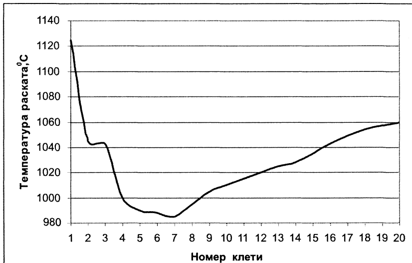
Рис.1. Изменение температуры раската по длине стана 320/150 при прокатке круглого профиля диаметром 10 мм в прутках (данные 1986 г.)

Такое значительное изменение температуры вдоль линии стана приводит к росту энергосиловых параметров деформации и соответствующему увеличению нагрузок на основное технологическое оборудование стана – рабочие клетки конца черновой – начала промежуточной групп. Высокая температура конца прокатки, в свою очередь, затрудняет решение задачи формирования струк-