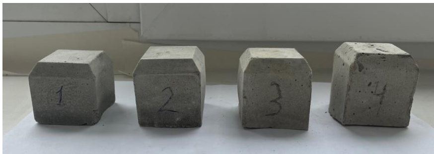
Рисунок 1 - Экспериментальные образцы бетона

Экспериментальные образцы бетона были исследованы под микроскопом (рис. 2). Образец 1 - контрольный, образец 2 – содержит 5% осадка водоподготовки, образец 3 - 10%, образец 4 - 15%.