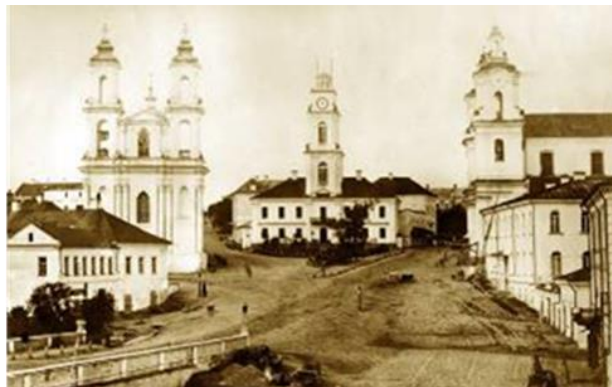
Рис. 2. Ратушная площадь в Витебске, 1867 г.

В конце XVIII в. территории Беларуси вошли в состав Российской империи. Города получили новые генеральные планы в стиле классицизма. Трансформировались общественные городские пространства: спрямлялись улицы, видоизменялись площади. В этот период создавалась система трех-четырёх разных по функциональному использованию площадей, которые соприкасались между собой, образуя компактную структуру (Витебск, Пинск, Слоним, Кричев) или формировали развитый центр, располагаясь на небольшом расстоянии (Гомель, Могилев, Ошмяны, Полоцк). Часто они находились на одной улице, служившей композиционной осью. Имели элементарные планы четырехугольной конфигурации, но были оформлены с помощью разных приемов композиционного решения застройки. Первый фронт формировали одинаковые по высоте здания, а высотные здания, являющиеся композиционными акцентами, размещались на удалении от периметра, что можно наблюдать в Могилеве. Площади имели «древнерусский генезис, нерегулярное планировочное построение и достаточно плотную застройку – ратушу, несколько храмов, корпуса торговых лавок, жильё» [12, с. 73]. В Витебске к концу XVIII в. сформировались четыре площади: две полифункциональные, предхрамовая и административная (Рис. 2). При этом «три основных площади центра были сгруппированы в компактный градостроительный ансамбль, целостный в функционально-планировочном, визуальном-пространственном и художественном отношениях» [12, с. 412].