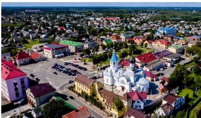
Рис. 1. Площадь Советская в Поставах

считать утраченными, так как здания, являющиеся доминантами в ансамбле поставской площади, а также ренессансных и барочных площадей других белорусских городов, не восстановлены и замкнутый контур разрушен.