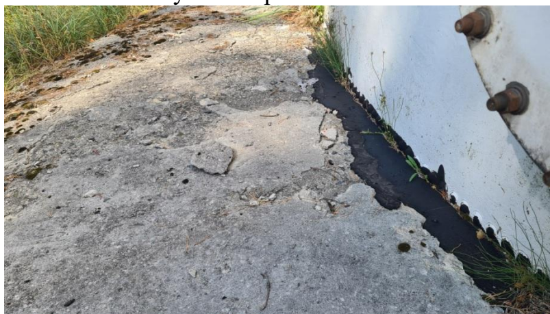
Рис. 3. Текущее состояние отмостки РВК-1000

Немаловажным моментом является выявленное нарушение сплошности гидрофобного слоя в зоне узла сопряжения нижнего пояса и днища.