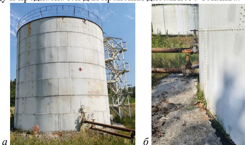
Рис. 1. РВК-1000 а – общий вид; б – клёпаная стенка

В качестве объекта исследования был выбран резервуар конструкции типа РВК [3, с. 6], изготовленный «полистовым» способом с соединением швов методом клёпки (см. рис. 1) непосредственно на территории нефтебазы в 1934 году и предназначен для хранения дизельного топлива.