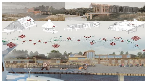
Рис. 1. Фрагмент концепции формирования системы речных вокзалов Беларуси

основе модульной сетки 6 \times 6 метров. Террасное расположение по рельефу этажей вокзала от первого этажа на уровне причала до четвертого этажа, объединенных лифтовой шахтой позволило организовать необходимое функциональное зонирование, соединенное комфортными пешеходными связями (Рис. 1).