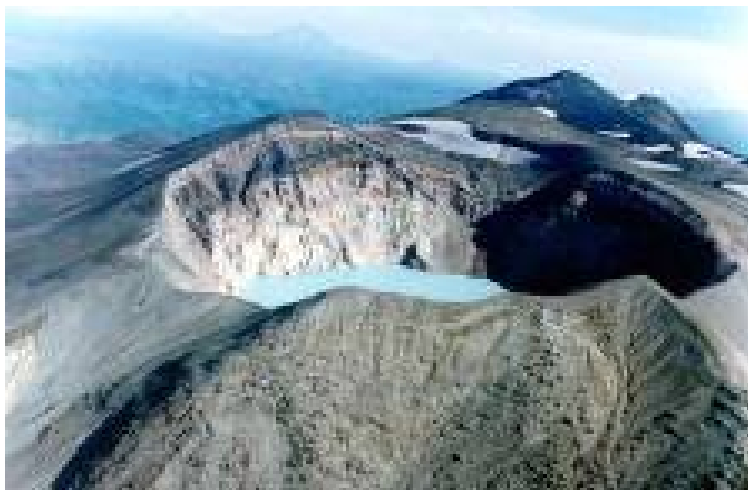
Рис. 3.2. Кислотное озеро – кальдера. Вулкан Малый Семьячик на Камчатке