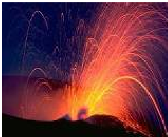
Рис. 1.3. Извержение стромболианского типа

силе взрывами из жерла, образуя, сравнительно короткие и более мощные потоки (рис. 1.3).