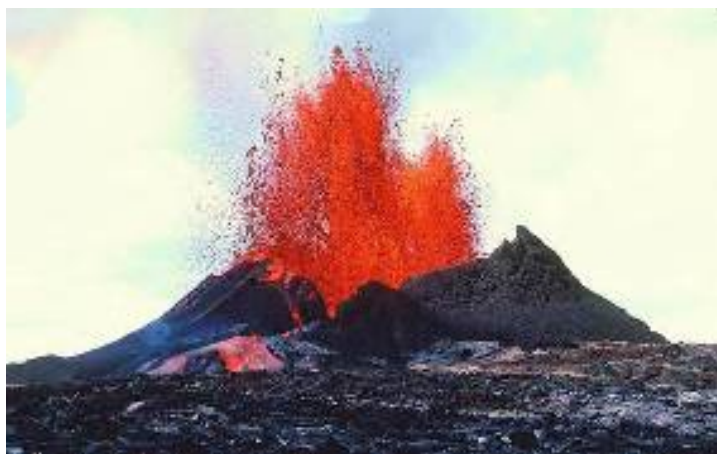
Рис. 1.2. Извержение жидкой базальтовой лавы. Вулкан Килауэа

Иногда изменения происходят вдоль разломов по серии небольших конусов (рис. 1.3).