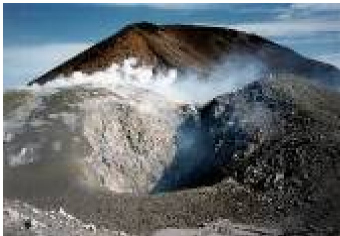
Рис. 1.6. Вулкан Кудрявый (фреатическое извержение)

Извержения пепловых потоков были широко распространены в недавнем геологическом прошлом, но в классическом виде не наблюдались человеком. В какой-то мере такие извержения должны напоминать палящие тучи или раскаленные лавины. В любом случае на поверхность поступает магматический расплав, который, вскипая, подобно молоку, разрывается, и раскаленные лапилли пемзы, обломки стекла, окруженные раскаленной газовой оболочкой, с огромной скоростью движутся по минимальным уклонам. По существу, это своеобразный высокотемпературный «аэрозоль». Возможным примером подобных извержений могло быть извержение в 1912 г. в районе вулкана Катмай на Аляске, когда из многочисленных трещинных жерл излился пепловый поток, распространившийся примерно на 25 км вниз по долине (рис. 1.7). Он имел мощность около 30 м. В центральной части потока частицы оказались слабо сваренными, а из потока долгое время поднимался пар, за что долина и получила название «Десять тысяч дымов». Важно подчеркнуть, что объем пепловых потоков, может достигать десятков и сотен кубических километров, что говорит о быстром опорожнении очагов с кислым расплавом. [2]