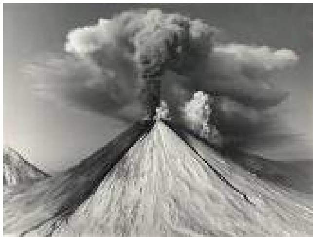
Рис. 1.4. Извержение вулкана Ключевской Сопки в 1991 г. соответствует плинианскому типу

Извержение вулкана Ключевской Сопки на рис. 1.4. наглядно демонстрирует плинианский тип.