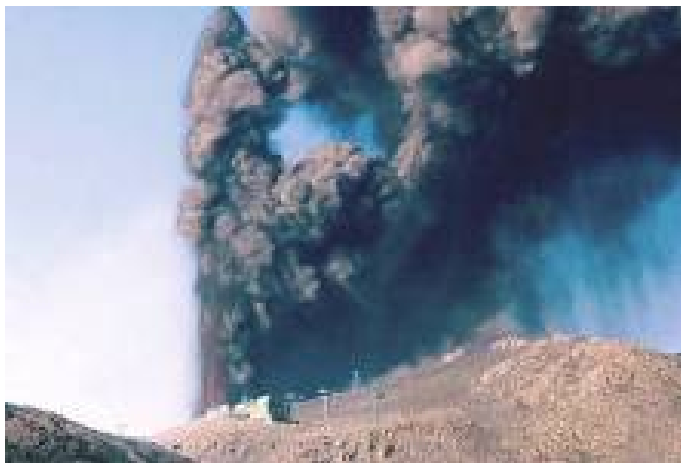
Рис. 1.5. Извержение пелейского типа. Извержение Этны

Извержение такого же типа произошло 30 марта 1956 г. на Камчатке, где грандиозным взрывом была уничтожена вершина вулкана Безымянного. Пепловая туча поднялась на высоту 40 км, а по склонам вулкана сошли раскаленные лавины, оставив после себя плащи пепла и пемзовые лапилли, которые, растопив обильные снега, дали начало мощным грязевым потокам. Высокая подвижность палящих туч достигается за счет выделения газов из раскаленных частиц, которые поддерживаются давлением газа, подобно кораблю на воздушной подушке.