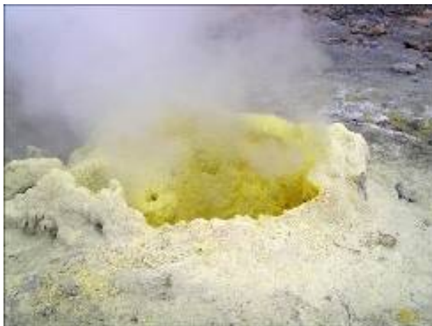
Рис. 3.1 Фумаролы Камчатки

тысячи лет без изменения. Мофетты — это фумаролы с температурой 100°C и ниже, выделяющие преимущественно углекислоту с примесью азота, водорода, метана и располагающиеся вблизи действующих вулканов или в области потухших вулканов (рис. 3.1.). Впадины, где находятся мофетты, называют долинами смерти, так как животные, попадая туда, задыхаются из-за скопления тяжелого CO 2 .