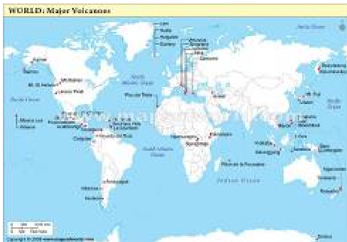
Рис. 2.1. Карта распределения вулканизма

В настоящее время на земном шаре насчитывается несколько тысяч потухших и действующих вулканов, причем среди потухших вулканов многие прекратили свою деятельность десятки и сотни тысяч лет, а в ряде случаев и миллионы лет назад (в неогеновый и четвертичный периоды), некоторые относительно недавно. По данным В.И. Влодавца общее количество действующих вулканов (с 1500 г. до н. э.) составляет 817, в число которых входят вулканы сольфатарной стадии (201).