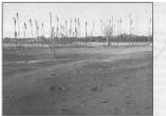
Рис. 1.7. Окрестности вулкана, покрытые пеплом и вулканическими бомбами

Нередко извержения разного типа происходят в мелководных условиях — в океанах и морях. Тогда их отличает образование огромного количества пара, возникающего от соприкосновения горячей магмы с водой. Такие извержения называются гидрорэксплозивными.