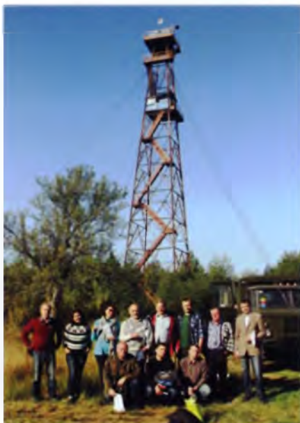
Рис. 8. Смотровая вышка в ландшафтном заказнике «Ольманские болота»

из наиболее посещаемых туристских объектов республики. Похожее решение реализовано и в Беларуси, на Ольманских болотах в Столинском районе. Бывшая авиационная наблюдательная вышка стала смотровой площадкой, позволяя с высоты 48 м увидеть этот почти бескрайний болотный мир (рис. 8). А далее по разработанному в республиканском ландшафтном заказнике «Ольманские болота» специальным маршрутам для орнитоло-