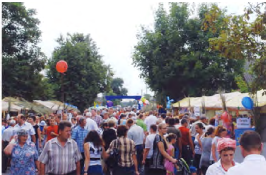
Рис. 17. Улица мастеров на фестивале «Мотальскія прысмакі». 2012 г.

шей рекламы и соответствующей среды, вплоть до интерьеров, которые создадут атмосферу достоверности приготовления того или иного традиционного блюда. Например, агроусадьба «У Рыся» в Зельвенском районе получила известность как место приготовления банкухи – своеобразного произведения кулинарного искусства (что-то среднее между кексом и бисквитом). А Белорусский государственный музей народной архитектуры и быта в этом году провел уже второй Сырный фестиваль под Минском, основное содержание которого состояло вовсе не в поедании сыров, а в пропаганде этого замечательного продукта и обучении его приготовлению. Безусловно, для такого фестиваля уже недостаточно интерьера хаты – надо готовить соответствующую территорию, продумать ее зонирование, оптимально