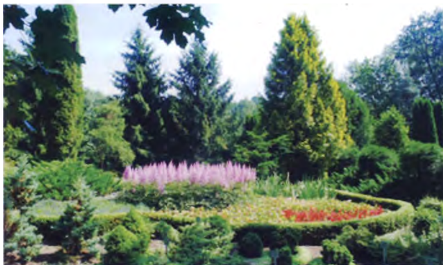
Рис. 1. Фрагмент ботанического сада Белорусской государственной сельскохозяйственной академии, г. Горки

Оптимизм основывается и на том, что сфера туризма в нашей стране типологически еще только развивается, дополняясь новыми направлениями деятельности. Подтверждением этому является статистика одного направления – сельского туризма. При увеличении в 2013-м по сравнению с предыдущим годом количества агроусадеб на 6% число отдохнувших на них туристов возросло на 22,1% (до 271 тыс. чел.), а доход вырос на 65% – до 73 млрд 181 млн руб. И это только начало пути.