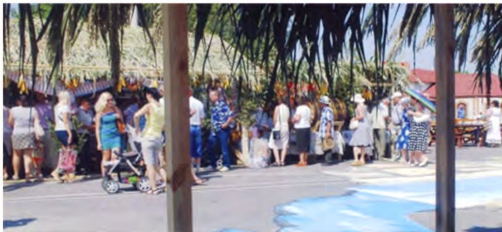
Рис. 16. Торговые ряды на фестивале «Мотальскія прысмакі» в агрогородке Мотоль Ивановского района. 2013 г.

Деловой туризм – путешествие со служебными или профессиональными целями: участие в научных семинарах и конференциях, производственных совещаниях, ярмарках, выставках и др. Популярными становятся по-