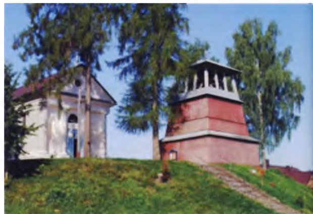
Рис. 2. Костел и колокольня в д. Шеметово Мядельского района. Вторая половина XVIII – начало XIX в.

Прошедший в Минске чемпионат мира по хоккею показал, что каждое направление туристской деятельности требует своего архитектурного обеспечения в виде специально выделенных территорий, пространств, зданий и сооружений, малых архитектурных форм, обеспечивающих интересы туристов, ориентированных именно на конкретное направление. В частности, фан-зоны потребовали применения соответствующего оборудования для реализации функций общения, отдыха, развлечений и т.д., в том числе торговли, причем тем товаром, который востребован именно в фан-зонах. А это значит, что в туризме обязательно следует учитывать возраст, уровень образования и другие характеристики потенциальных туристов.