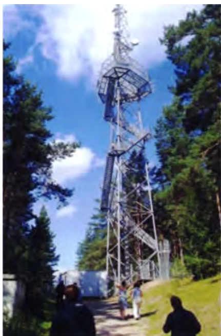
Рис. 7. Литва. Смотровая вышка в Аукштайтии

из наиболее посещаемых туристских объектов республики. Похожее решение реализовано и в Беларуси, на Ольманских болотах в Столинском районе. Бывшая авиационная наблюдательная вышка стала смотровой площадкой, позволяя с высоты 48 м увидеть этот почти бескрайний болотный мир (рис. 8). А далее по разработанному в республиканском ландшафтном заказнике «Ольманские болота» специальным маршрутам для орнитоло-