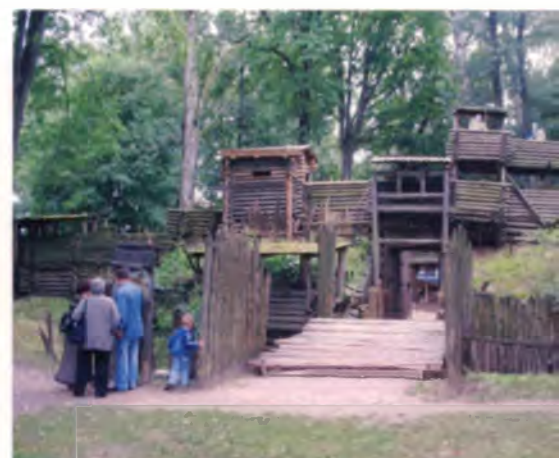
Рис. 20. Латвия. Реконструкция крепости XII в. в Лиелварде

Все это показывает, что интересы туристов различны (есть еще оздоровительное, этническое и иные направления). Поэтому практически любое тематическое предложение мо-