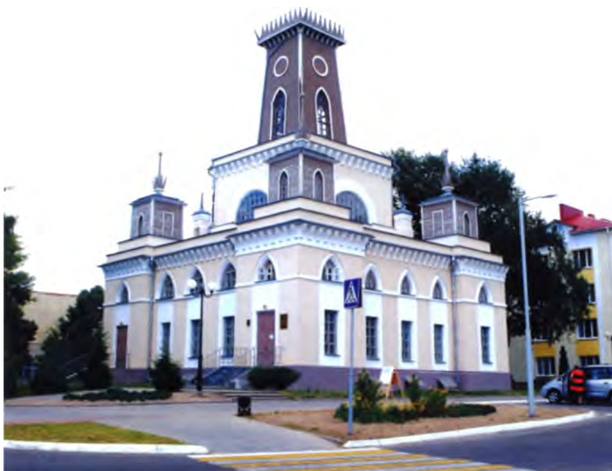
Рис. 3. Ратуша в Чечерске. Вторая половина XVIII в.

му предпочтений людей, желающих отправиться в путешествие, и готовить соответствующие предложения, в том числе и средствами архитектуры.