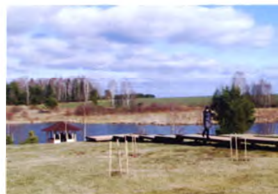
Рис. 5. Спуск к озеру на рыболовно-охотничьей базе Копыльского лесхоза

Экологический туризм – путешествие в природные территории, знакомство с живой природой, местными обычаями и культурой. Мировая практика показывает, что рост числа туристов за год составляет около 4%, экологов – 30%. 40–60% всех международных туристов составляют экотуристы, ориентированные на получение впечатлений от флоры, а 20–40% – на восприятие фауны. Все страны стараются привлечь таких туристов, особенно тех, которые стремятся получить особо эксклюзивные, лично ими выполненные фотографии или просто побывать в малопосещаемых местах. Как правило, это люди состоятельные, увлеченные, готовые ради удовлетворения своего интереса практически на любые траты.