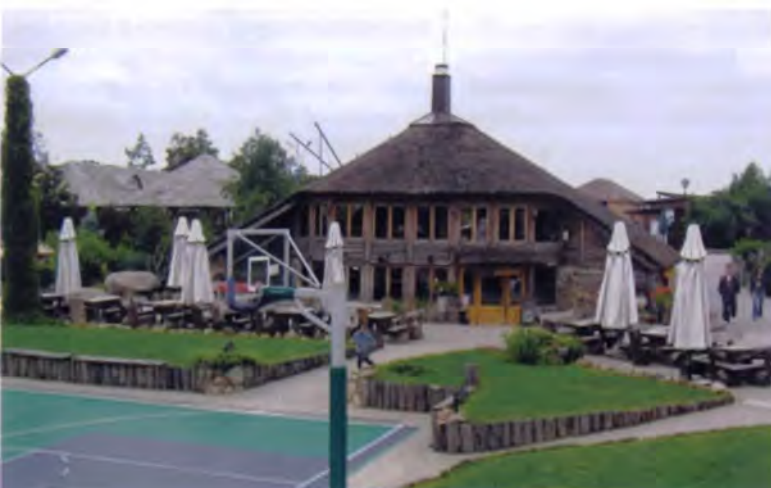
Рис. 21. Литва. Туристский поселок «У Йозаса» в д. Жибининкай около Паланги

Вариантов таких объектов очень много. Например, к городку Лиелварде в Латвии привлекает внимание реконструкция на территории реального городища деревянного замка древнебалтских племен XII в., выполненная на достоверных исторических материалах (рис. 20). Этот небольшой по размерам комплекс площадью 29 соток обладает значительным познавательным материалом, хотя функционирует только в теплый период времени. Конечно же, кроме информации о прошлом, туристы могут рассчитывать на обед и аттракционы, поучаствовать в ритуалах. А некоторые здесь, где особо остро воспринимаются вечные ценности человеческого бытия, даже устраивают свои свадьбы.