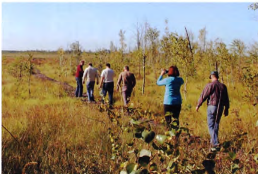
Рис. 9. Тропа через болото в ландшафтном заказнике «Ольманские болота»

Велосипедный туризм – один из видов активного отдыха и разнообразность спортивного туризма . Он предполагает наличие, с одной стороны, возможность проехать практически везде, с другой – необходимость готовить специальные трассы, содержащие объекты экскурсионного характера, общие для туризма и специфические для велотуризма. Данное направление сейчас активно развивается, вплоть до формирования, напри-