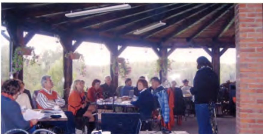
Рис. 19. Семинар в конференц-зале комплекса «Панскі маэнтак Сула»

Например, пока в Беларуси нет ни одного мини-скансена – объекта туристского назначения, состоящего из нескольких сооружений, которые достоверно воссоздадут, желательно в реальной градостроительной ситуации, исторические архитектурные и конструктивные формы в виде крестьянской усадьбы в структуре деревни или на хуторе [3]. И даже если есть что-то претендующее на данное направление, все же заметно смешение стилей, все строится на компиляции, а не на той достоверности, которая может быть воссоздана только на строго научной основе (допустим, для XVIII – начала XIX в. – с курной печью, земляными полами, соломенной кровлей и т.д.). Счет таких туристских объектов в каждой из стран Скандинавии идет на сотни, они востребованы и, что важно, выполняют параллельно и просветительно-воспитательные функции. Ничто лучше и нагляднее рассказать ребенку о прошлом Родины не может. Собственно, поэтому люди туда и стремятся попасть, особенно семьями, с детьми.