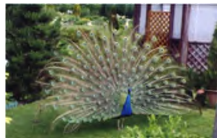
Рис. 6. Павлин в агроусадьбе «Верес» Зельвенского района

В Литве поначалу предполагалось на самой высокой географической отметке установить вышку сотовой связи. Туристские организации предложили свое решение – совместить ее со смотровой площадкой, позволяющей обозреть дали легендарного историко-этнического региона страны – Аукштайтии (рис. 7). И теперь это один