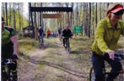
Рис. 11. Начало велотура по Воложинскому району

мер в Воложинском районе, сети веломаршрутов (рис. 10), в подготовке объектов для стоянок, мест отдыха и, если потребуется, ночлега путешественников. Важно обозначить доступными средствами, лучше малыми архитектурными формами (ворота в виде арки или традиционной браны, беседка, навес и др.), начало и завершение трассы (рис. 11). Веломаршруты следует разделять по степени сложности, совмещать спортивную сторону путешествия с познавательной. По ходу маршрутов устанавливаются стенды с информацией о местных достопримечательностях, истории края и его природе. В Воложине эту информацию оформили в современной подаче – не тексты с картинками, а возможность туристу самому по внешнему виду образцов, по текстуре древесины и т.д. определить виды произрастающих здесь деревьев (рис. 12).