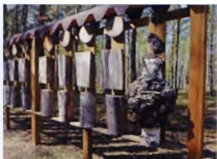
Рис. 12. Инсталляция о древесных породах, произрастающих в Налибокской пуще, на веломаршруте

мер в Воложинском районе, сети веломаршрутов (рис. 10), в подготовке объектов для стоянок, мест отдыха и, если потребуется, ночлега путешественников. Важно обозначить доступными средствами, лучше малыми архитектурными формами (ворота в виде арки или традиционной браны, беседка, навес и др.), начало и завершение трассы (рис. 11). Веломаршруты следует разделять по степени сложности, совмещать спортивную сторону путешествия с познавательной. По ходу маршрутов устанавливаются стенды с информацией о местных достопримечательностях, истории края и его природе. В Воложине эту информацию оформили в современной подаче – не тексты с картинками, а возможность туристу самому по внешнему виду образцов, по текстуре древесины и т.д. определить виды произрастающих здесь деревьев (рис. 12).