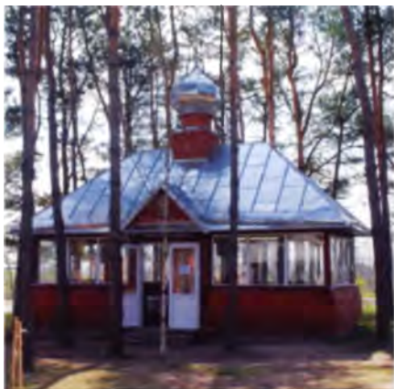
Рис. 15. Трапезная в Свято-Елисеевском Лавришевском монастыре в Новгородском районе. Начало XXI в.

шей рекламы и соответствующей среды, вплоть до интерьеров, которые создадут атмосферу достоверности приготовления того или иного традиционного блюда. Например, агроусадьба «У Рыся» в Зельвенском районе получила известность как место приготовления банкухи – своеобразного произведения кулинарного искусства (что-то среднее между кексом и бисквитом). А Белорусский государственный музей народной архитектуры и быта в этом году провел уже второй Сырный фестиваль под Минском, основное содержание которого состояло вовсе не в поедании сыров, а в пропаганде этого замечательного продукта и обучении его приготовлению. Безусловно, для такого фестиваля уже недостаточно интерьера хаты – надо готовить соответствующую территорию, продумать ее зонирование, оптимально