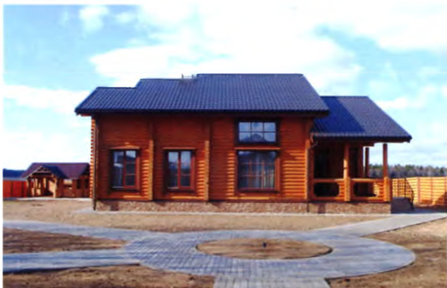
Рис. 4. Гостевой дом рыболовно-охотничьей базы Копыльского лесхоза

ка и охота (рис. 4, 5), агротуризм становится все более многопрофильной структурой, оперативно реагирующей практически на любые запросы [2]. Но пока только он стремится учесть перечисленное выше видовое разнообразие туризма. Например, где у нас можно увидеть павлина, и не в клетке или загоне, а прогуливающимся по лужайке (рис. 6)?