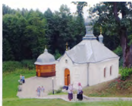
Рис. 14. Церковь Рождества Богородицы и павильон над купелью в Пустыньском Свято-Успенском монастыре в Мстиславском районе. Начало XXI в.

Гастрономический туризм при котором целью является знакомство с кухней той или иной страны, интересен тем, кому наскучил обычный туризм или тем, кто хочет внести разнообразие в свой рацион. Он может быть организован лишь при наличии мастеров высокого класса, хоро-