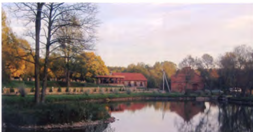
Рис. 18. Комплекс «Панскі маэнтак Сула» в д. Сула Столбцовского района

ездки, предоставленные руководством своим сотрудникам в качестве поощрения за хорошую работу, а также организация выездных семинаров, совещаний, конференций. В целом доля делового туризма немалая – до 20% в общем туристском объеме. Как правило, такой туризм совмещается с познавательным, все более востребованными становятся не городские гостиницы, а загородные клубы и туристские комплексы. Они кроме проживания и питания должны обеспечить и возможность проведения совещаний. Показательным подходом к формированию подобного комплекса вблизи Минска стал агротуристический комплекс «Панскі маэнтак Сула» в д. Сула Столбцовского района, созданный с использованием сохранившихся фрагментов усадьбы второй половины XIX в. Восстановлена среда типичного поместья с парком и водоемом, хозяйственными сооружениями (рис. 18). Ответствен-