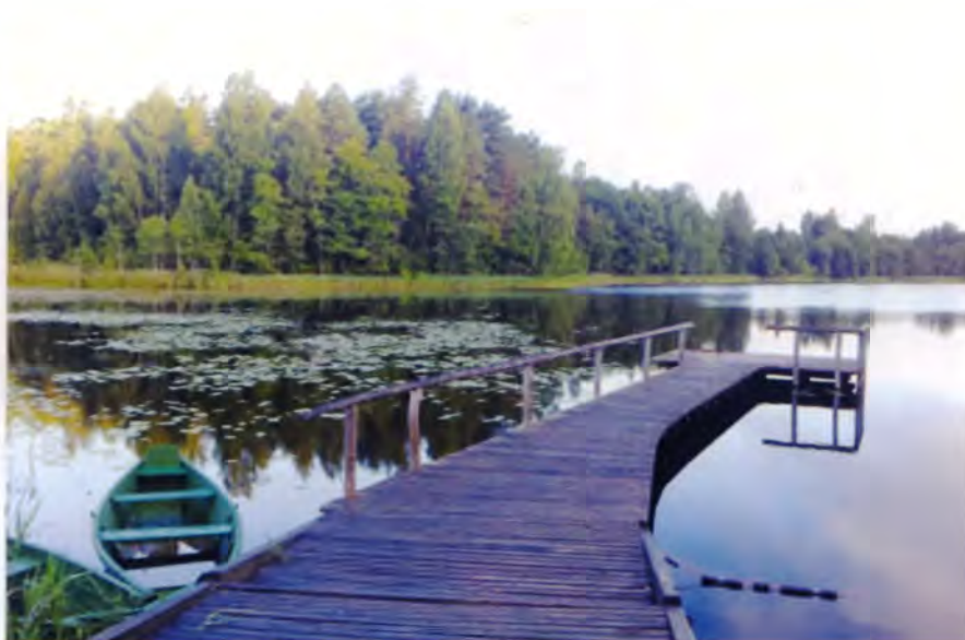
Рис. 13. Литва. Причал на водном туристском маршруте

Водный туризм заключается в путешествии по водной поверхности на плотках, сплавных и парусных катамаранах, байдарках и др. Но пока преобладает упрощенное представление о водном туризме. А трассы сле-