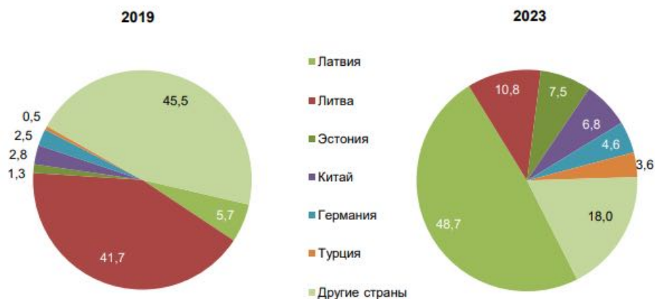
Рисунок 1 – Доля туристов в Беларуси

Одним из барьеров в развитии туризма между странами является удаленность дестинаций и связанные с этим высокие транспортные издержки. Открытие новых авиамаршрутов способствует активизации туризма. Запустила маршрут Урумчи–Минск с одним рейсом в неделю, продолжительностью полета около 6 часов и стоимостью от 222 евро в одну сторону. В том числе привлекательность этих дестинаций для потребителей двух