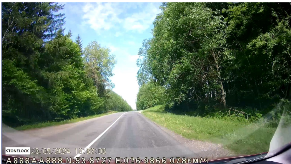
Рисунок 4 – Примыкание не видно в 83 метрах. Неожиданное торможение и высокая скорость вызовут наезд сзади

При скорости движения 78 км/ч, как у автомобиля на рис. 4, остановочный путь составит 83,11 м, что не позволит безопасно остановиться в случае появления препятствия на пересечении.