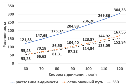
Рисунок 1 – Сравнение расстояний видимости для остановки на пересечении

Если при изменении скорости от 60 км/ч до 120 км/ч провести расчеты по (2), (3) с учетом рекомендуемых в нашей стране значений констант, а также по (4), приняв в этой формуле время реакции 1,8 с, то для горизонтального сухого участка, для легкового автомобиля получим следующие значения видимости (рис. 1).