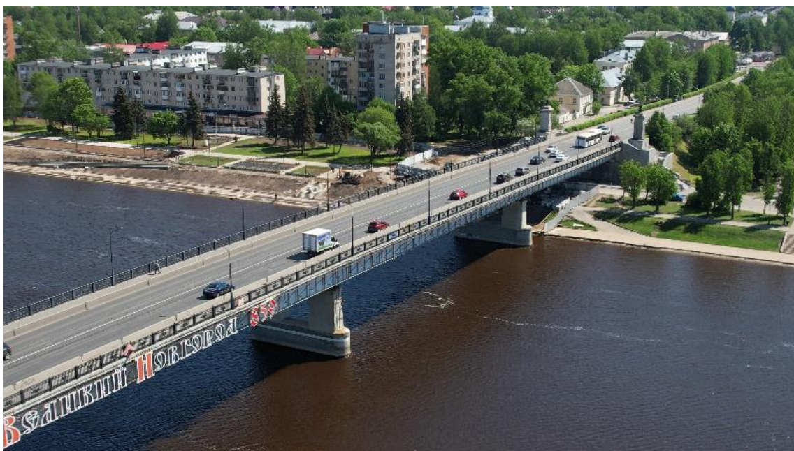
Рисунок 2 – Фотография моста в наше время

После освобождения Новгорода от немецких войск для обеспечения скорейшей транспортной коммуникации был наведён понтонный мост, шедший от Владимирской башни Детинца к улице Большевиков (Бояна). В феврале 1945 года на месте современного моста им. А. Невского было начато строительство временного деревянного, который был запущен в эксплуатацию к концу 1945 года.